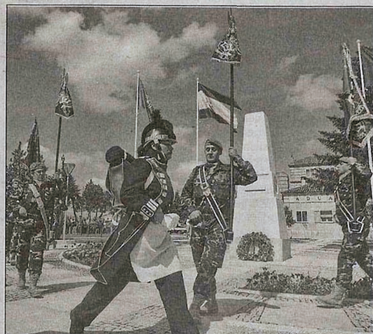
Homenaje a las banderas durante los actos del bicentenario de la batalla oñoreña.

Como invitado especial y con protagonismo específico estaba el actual duque de Ciudad Rodrigo, el décimo en la ostentación del ducado mirobrigense. Arthur Charles