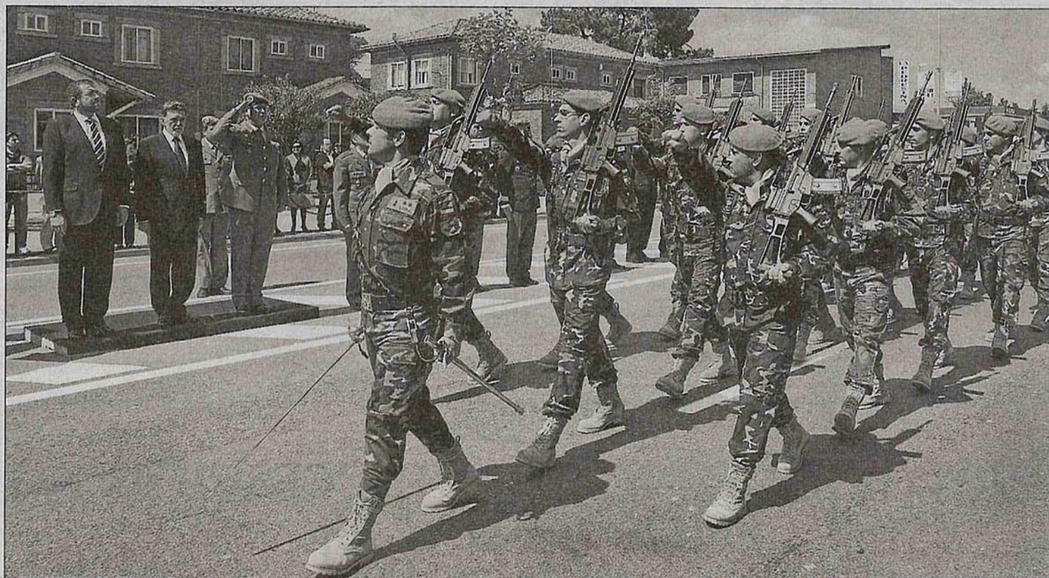
Desfile militar ante las autoridades que presidieron los actos conmemorativos.

Con la formación protocolaria establecida en el estrado montado al efecto, se procedió al izado de las banderas de los países protagonistas de la batalla de Fuentes de Oñoro; por un lado, Francia, y en el otro, las tropas aliadas conformadas por el Reino Unido, Portugal y España. Los respectivos himnos fueron interpretados por la banda militar que participó en los actos.