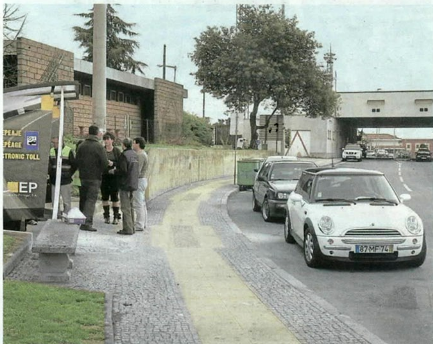
Conductores, en el cajero 24 horas de la frontera de Vilar Formoso en Portugal.

Ayer ya se podía efectuar el pago de las tasas en el cajero 24 horas pero no imprimía el ticket de papel que acredita la transacción