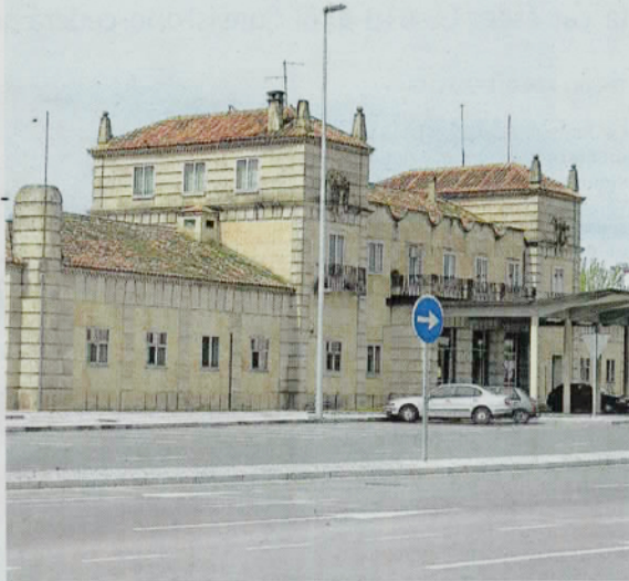
Edificio aduanero en el límite de Fuentes de Oñoro con Portugal.

El regidor calificó esta cesión como uno de los temas más importantes para el municipio junto con la construcción del área de servicio para mitigar la desviación del tráfico fronterizo.