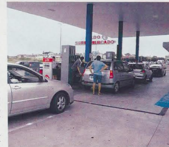
En las gasolineras de Fuentes de Oñoro se forman largas colas.

"Ya cobran en otros tramos y no nos ha quedado otra que asumirlo", dice un cliente portugués de una tienda de la frontera