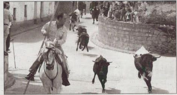
Los grupos de jóvenes también disfrutaron con las vaquillas / MONDRIÁN