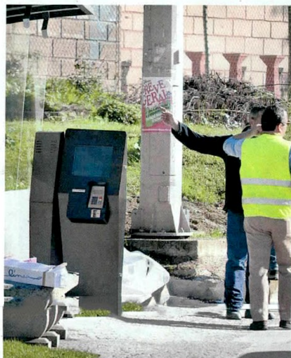
Los operarios instalaron ayer el cajero que dispensa tarjetas prepago.

Los operarios también se apresuraban ayer a colocar los precios de los peajes en el primer arco de la A-25 hacia Aveiro. Los conductores que realicen el viaje de ida y vuelta entre Fuentes de Oñoro y Aveiro pagarán 34,20 euros en el caso de los turismos y motos (clase 1), 59,40 euros si van en furgonetas o autobuses (clase 2), 76,20 euros para camiones de 3 ejes (clase 3) y 85,20 euros para los de 4 ejes (clase 4). La única ventaja en estancias de 3 días para los vehículos de clase 1 y 2 es el ticket virtual con 'tarifa plana' de 20 euros para viajes ilimitados. La medida del telepeaje afectará de forma negativa, no sólo por los elevados precios sino también por el complicado sistema de pago, al turismo y comercio en Portugal así como a los establecimientos de la frontera que prevén caídas en las ventas.