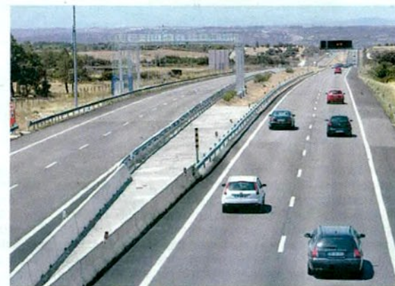
Muchos salmantinos optaron viajar a Lisboa por Badajoz.

Los cálculos son claros. En las estancias de más de tres días, viajar a la capital lusa por Vilar Formoso hasta Guarda, tomar la autopista A-23 hasta engancharse con la A-1 que conduce a Lisboa supone un coste en peajes entre ida y vuelta de 56,30 euros para un turismo. Otra alternativa es viajar por la A-25 hasta Mangualde, y desde allí tomar la IP-3 —que tiene varios tramos con un sólo carril en cada sentido— hasta la A-1. Este recorrido sale por 42 euros. Ambas opciones son más caras que hacer Salamanca-Badajoz y desde allí tomar la A-6 hasta Lisboa. Ida y vuelta salen por 30,80 euros en