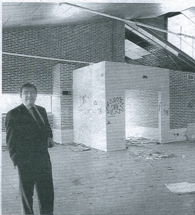
La estación de autobuses se abandonó sin llegar a funcionar.

El Consistorio oñorense ofrece como principal opción para ubicar dicho polígono los terrenos de la estación de autobuses, infraestructura completamente financiada por la Junta, pero que una vez construida fue abandonada sin llegar a inaugurarse, quedando en un estado de total abandono. Estos 20.000 metros cuadrados, ya urbanizados y con electricidad, son la "mejor opción" según Alanís.