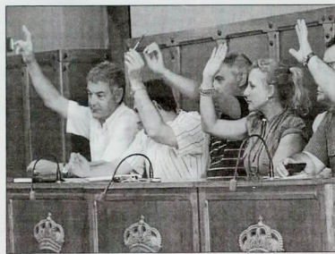
Congresalistas socialistas en el salón de plenos del Ayuntamiento mirobrigense. WICENTE

Cordero aclaró que llevaban al menos dos meses de negociaciones y que, si todo iba en la línea esperada, se podría empezar