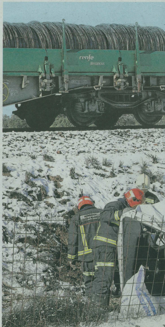
Estado en el que quedó el vehículo del fallecido, con el tren al fondo.

Vecinos que fueron consultados ayer por este diario no descartan realizar algún tipo de acción para presionar a Adif, lo que tiene claro es que si no pone ya solución a esta situación, no se van a quedar de brazos cruzados a la espera de que pasen más desgracias.