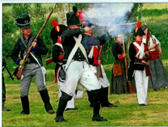
Un recreador de las tropas inglesas dispara ante el ataque de las tropas francesas.

Pasó hace 200 años en Fuentes de Oñoro, a principios de mayo, junto a la rivera del Dos Casas, y dejó casi 5.000 muertos. Masséna, el valido napoleónico en territorio español, fue sacrificado. No solo se perdió la batalla de Fuentes de Oñoro en aquella contienda: Almeida, la plaza fuerte de Portu-