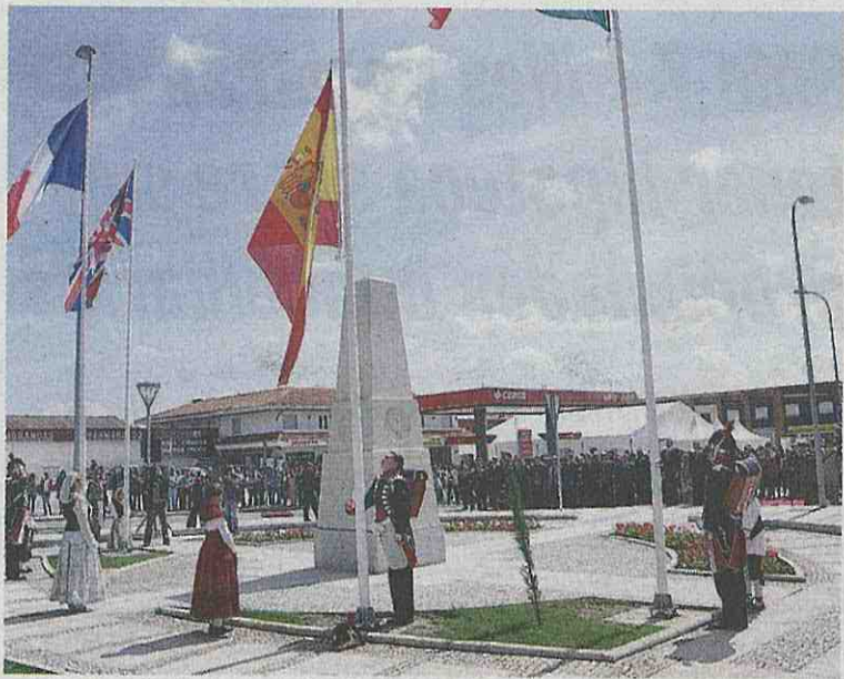
Las autoridades durante los actos de conmemoración del Bicentenario de la Batalla de Fuentes de Oñoro y el descubrimiento del monolito