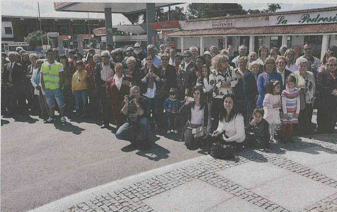
Vecinos de ambos lados de La Raya participaron en los actos del Bicentenario

Un desfile militar en la avenida Europa, ante centenares de vecinos y visitantes que emocionados no han parado de aplaudir durante todo el transcurso de la marcha, fue