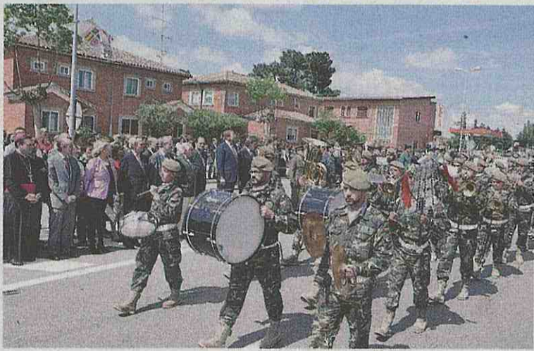
Desfile militar en la avenida de Europa de Fuentes de Oñoro

Relevancia. La Batalla napoleónica de Fuentes de Oñoro que ahora conmemora el municipio tiene una destacada relevancia. Según explicó el comisario de la expo-