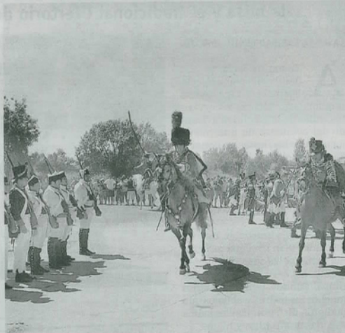
Los husares de Napoleón cargaron con furia contra las defensas aliadas.

La batalla por el control de la localidad comenzó en la explanada adyacente a la plaza de toros, donde se produjo la primera recreación, reproduciendo los movimientos y tácticas de la época de un combate en campo