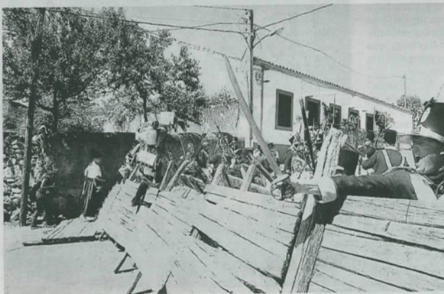
Los aliados defendieron el terreno de Fuentes de Oñoro palmo a palmo desde las barricadas.

Éxito de público. Cientos de personas se acercaron la mañana de ayer hasta Fuentes de Oñoro para disfrutar de la histórica batalla.