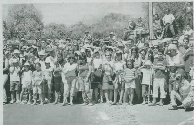
El público no se perdió un minuto de la espectacular representación de las guerras napoleónicas.