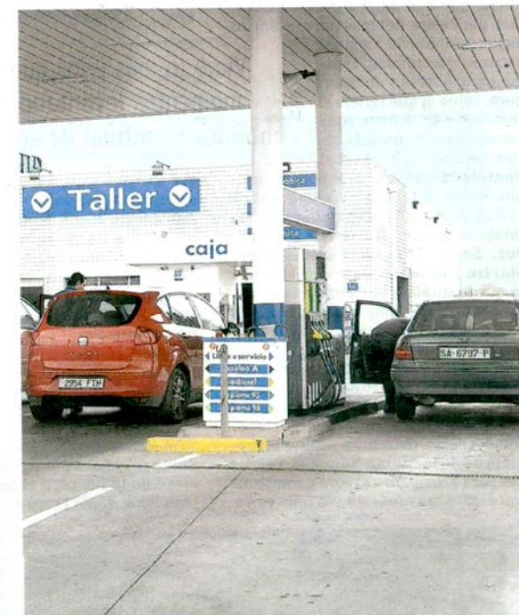
Vehículos repostando en una estación de servicio de Salamanca.

Pese al elevado coste que supone circular en coche, la mayor parte de los ciudadanos no renuncia a viajar esta Semana Santa, el puente del año con más tráfico en las carreteras. Mañana por la tarde, desde las 13:00 horas, la Dirección General de Tráfico pone en marcha la segunda fase, la más importante de la operación especial de Semana Santa. La Jefatura Provincial de Tráfico prevé 160.000 desplazamientos por las carreteras de Salamanca desde mañana