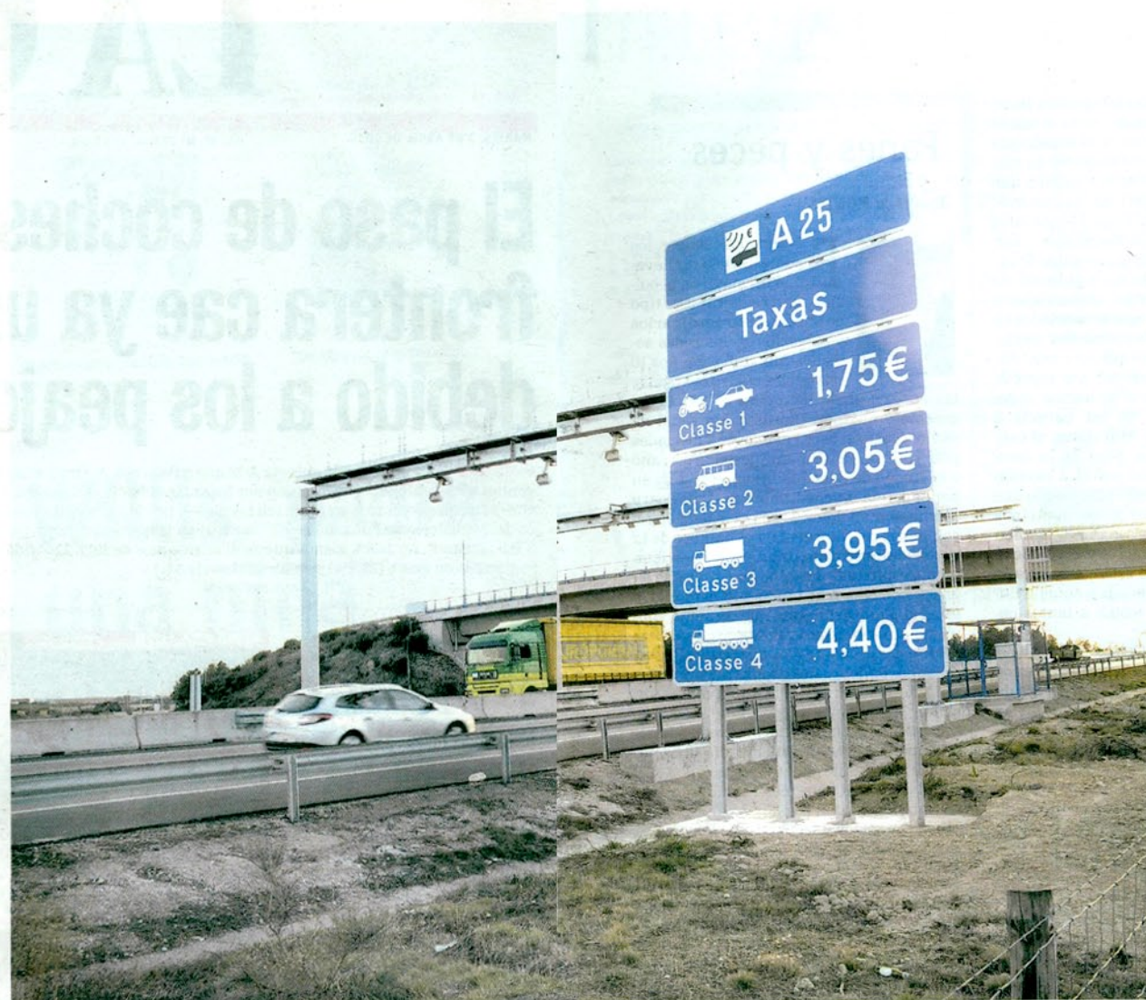
Arco de peaje en la autovía lusa A-25 en Vilar Formoso.

■ PAGAR EN LOS HOTELES. Portugal, que no acaba de encontrar el sistema idóneo para que los peajes sean abonados por los extranjeros, estudia ahora la posibilidad de que los conductores foráneos puedan pagar las tasas con tarjeta de crédito en los hoteles en los que se hospeden.