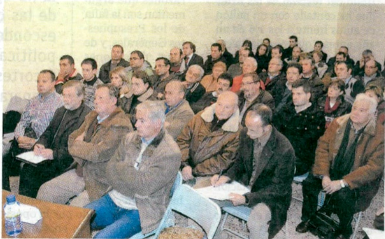
Reunión en Fuentes de Oñoro de ayuntamientos y sectores afectados.

■ El grupo de trabajo de Fuentes de Oñoro pedirá apoyo institucional, pero no descarta protestas