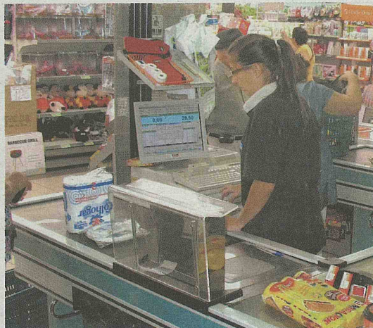
El comercio de Fuentes de Oñoro se beneficia de las compras de los portugueses

■ REBAJAR LOS PLAZOS. Bermúdez de Castro explicó, además, que ahora mismo la electrificación tiene, a su juicio, mucho más interés que cualquier otro proyecto de infraestructuras para Salamanca: "Estamos intentando, a través de conversaciones con el Ministerio de Fomento, que se rebaje la ejecución de la electrificación de 28 a 24 meses, así como los 90 minutos de viaje a Madrid" en tren.