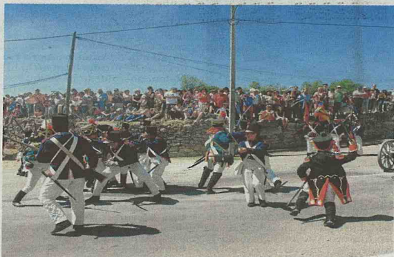
Recreación histórica de la Batalla de Fuentes de Oñoro.

Durante el año gran número de británicos visitan Fuentes para conocer el lugar donde guerrearon sus antepasados